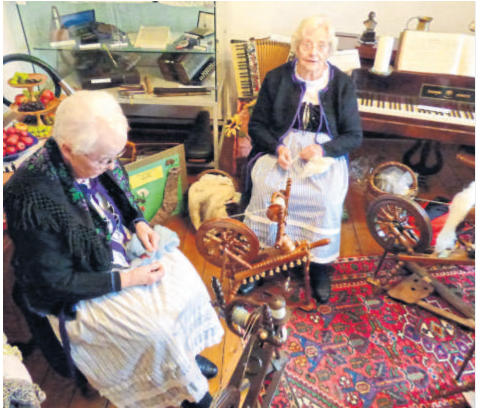
Ean de Spinnstubb'.