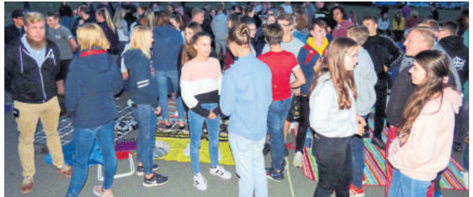
So viele Jugendliche sieht man bei Gottesdiensten sonst nur selten. Der Jugendgottesdienst lockt viele junge Gläubige an.

chengemeinde Pohlheim, die evangelische Gemeinschaft Holzheim/Dorf-Güll, die evangelische Kirchengemeinden Watzenborn-Steinberg/Holzheim/Dorf-Güll/Grünungen, die katholische Pfarrei St. Martin und das evangelische Jugenddekanat Hungen.