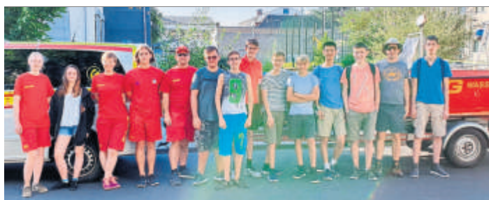
Schülergruppe und Anleiter am Schulgelände

Wer sportlich ist, schwimmen kann und schon immer mal wissen wollte, was Katastrophenschutz ist, war bei diesem Projekt genau richtig. Der DLRG sucht übrigens ständig Nachwuchs für seine wichtigen Aufgaben im Ehrenamt, vielleicht wird nach dem Schulprojekt bei Einzelnen der Wunsch konkret, sich in diesem Bereich zu engagieren.