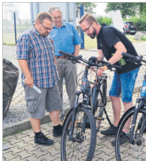
Die E-Bikes stoßen bei den Besuchern auf großes Interesse.

Zudem gab es einen Vortrag über die Wirtschaftlichkeit von Fotovoltaikanlagen und deren Kombination mit moderner Speichertechnik.