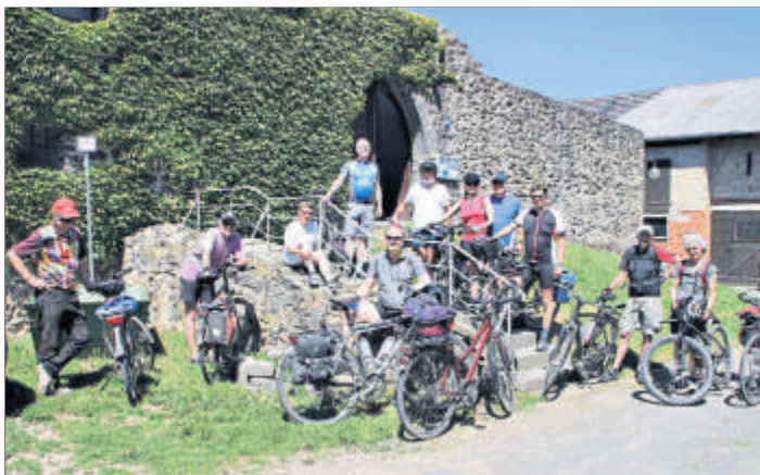
Bereits zum vierten Mal besuchte die Radlergruppe aus Frankfurt das Burgcafé der Grüninger Burgfrauen

Gut gestärkt und ausgeruht fuhren sie die Strecke, teils am Limes entlang, wieder in ihre Heimat zurück. Zum Burgcafé kamen auch wieder viele treue Gäste unter anderem aus Garbenteich, Dorf-Güll, Watzenborn-Steinberg und selbstverständlich auch Grüninger, worüber sich die Burgfrauen sehr gefreut haben.