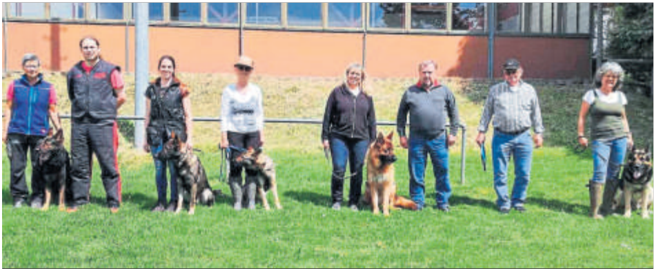
Die Hundebesitzer mit ihren Schäferhunden.