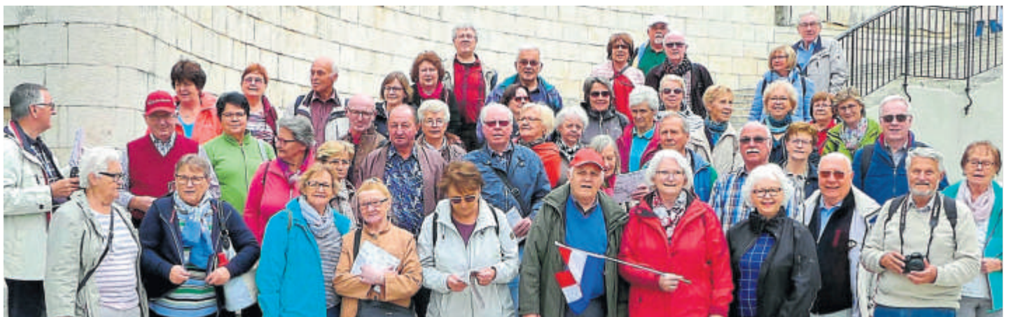
Gemeinsame Partnerschaftsfahrt von Pohlheim und Admont nach Kroatien

Einwöchige Reise der Partnerschaftsvereine Admont und Pohlheim nach Kroatien