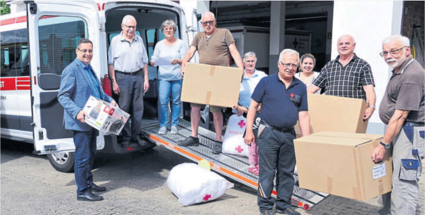
Rund 1,5 Tonnen Hilfsgüter gehen mit auf die Reise.