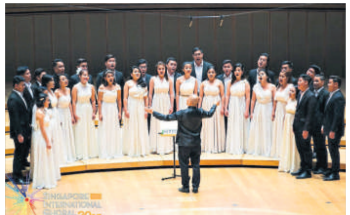
»Los Cantantes de Manila«

Der Chor Los Cantantes de Manila, der sich der Aufgabe verschrieben hat, philippinischer Kulturbotschafter des guten Willens zu sein, wurde zweimal von der Nationalen Kommission für Kunst und Kultur für seine internationalen Auszeichnungen mit dem Preis »Ani ng Dangal« ausgezeichnet. Der Chor wird auch in Zukunft seine Bemühungen um den guten Willen und die Einzigartigkeit der von Gott gegebenen himmlischen Musik fortsetzen.