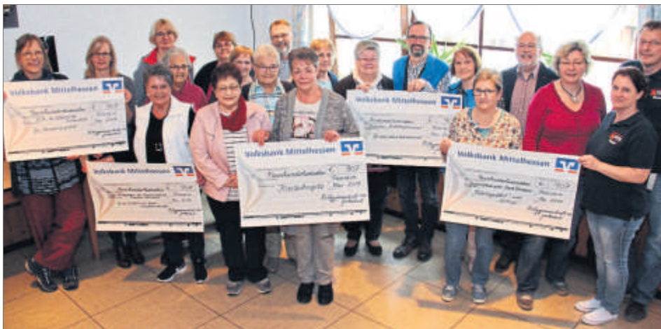
Die Spendenübergabe des Vereinsvermögens an fünf Institutionen.

Watzenborn-Steinberg: 19 Uhr, Häuser Be-stattungen, Trauertreff